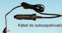
Kábel do autozapaľovača